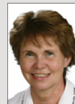
Eva Wirth Medienberatung

Tel. (04751) 901-178 Fax (04751) 901-4178 krueger-hoffmann@nez.de