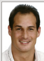
Meik Kremer Medienberatung