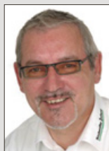
Jens Riedel Medienberatung

Tel. (04751) 901-165 Fax (04751) 901-199 kremer@nez.de