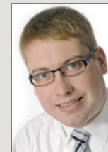
Frank Steffens Medienberatung Hafen, Groden, Abschnede

Tel. (04721) 585-302 Fax (04721) 585-230 larndt@cuxonline.de