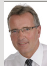
Lothar Arndt Medienberatung Cuxtipps, CuxJournal Sonderpublikation

Tel. (04721) 585-232 Fax (04721) 585-4232 gmassow@cuxonline.de